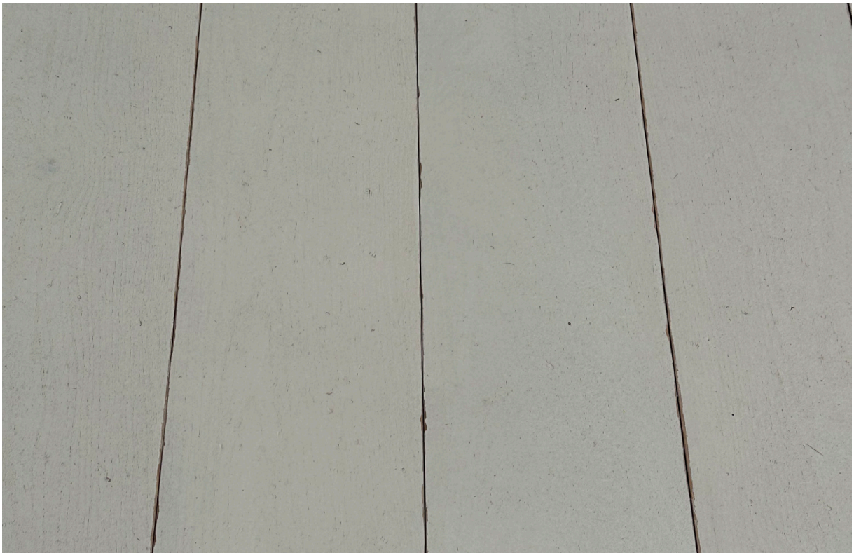
Photo non contractuelle, le bois, matériau vivant présente des variations naturelles de teintes et veinage, des singularités telles que le brossage, densité, taille des nœuds, gerces, masticages... Chaque lame est originale et différente, c'est ce qui confère toute la richesse et la noblesse au bois. Il est essentiel de rappeler qu'une exposition aux UV génère une variation durable de la teinte du bois. Le Client est invité à se référer à la fiche technique du produit afin de connaître ses caractéristiques