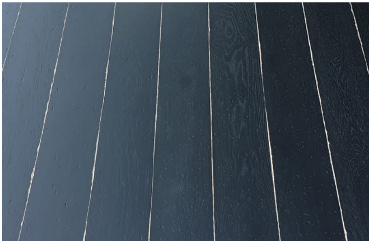
Photo non contractuelle, le bois, matériau vivant présente des variations naturelles de teintes et veinage, des singularités telles que le brossage, densité, taille des nœuds, gerces, masticages... Chaque lame est originale et différente, c'est ce qui confère toute la richesse et la noblesse au bois. Il est essentiel de rappeler qu'une exposition aux UV génère une variation durable de la teinte du bois. Le Client est invité à se référer à la fiche technique du produit afin de connaître ses caractéristiques