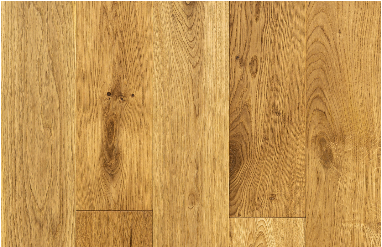
Photo non contractuelle, le bois, matériau vivant présente des variations naturelles de teintes et veinage, des singularités telles que le brossage, densité, taille des nœuds, gerces, masticages... Chaque lame est originale et différente, c'est ce qui confère toute la richesse et la noblesse au bois. Il est essentiel de rappeler qu'une exposition aux UV génère une variation durable de la teinte du bois. Le Client est invité à se référer à la fiche technique du produit afin de connaître ses caractéristiques