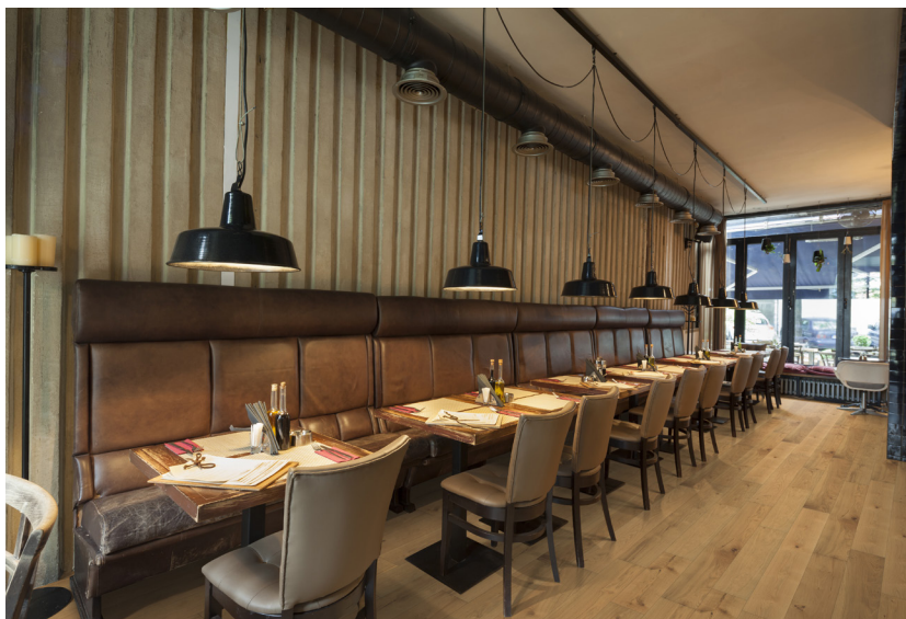
Photo non contractuelle, le bois, matériau vivant présente des variations naturelles de teintes et veinage, des singularités telles que le brossage, densité, taille des nœuds, gerces, masticages... Chaque lame est originale et différente, c'est ce qui confère toute la richesse et la noblesse au bois. Il est essentiel de rappeler qu'une exposition aux UV génère une variation durable de la teinte du bois. Le Client est invité à se référer à la fiche technique du produit afin de connaître ses caractéristiques