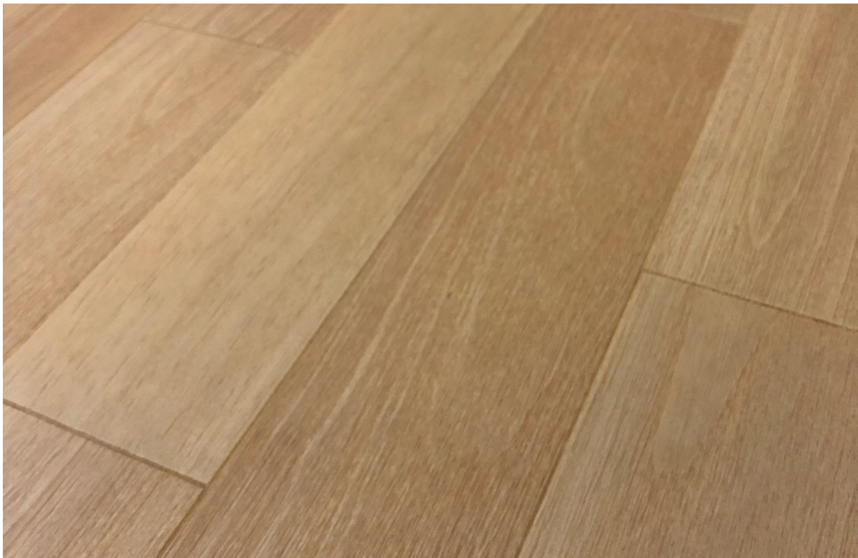
Photo non contractuelle, le bois, matériau vivant présente des variations naturelles de teintes et veinage, des singularités telles que le brossage, densité, taille des nœuds, gerces, masticages... Chaque lame est originale et différente, c'est ce qui confère toute la richesse et la noblesse au bois. Il est essentiel de rappeler qu'une exposition aux UV génère une variation durable de la teinte du bois. Le Client est invité à se référer à la fiche technique du produit afin de connaître ses caractéristiques