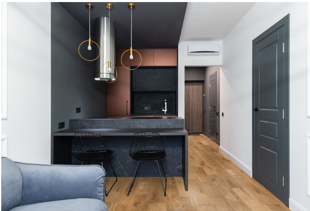
Photo non contractuelle, le bois, matériau vivant présente des variations naturelles de teintes et veinage, des singularités telles que le brossage, densité, taille des nœuds, gerces, masticages... Chaque lame est originale et différente, c'est ce qui confère toute la richesse et la noblesse au bois. Il est essentiel de rappeler qu'une exposition aux UV génère une variation durable de la teinte du bois. Le Client est invité à se référer à la fiche technique du produit afin de connaître ses caractéristiques